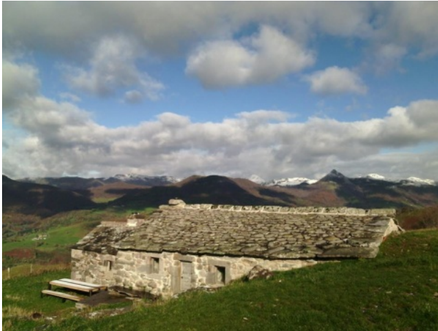
Buron de la Chambe situé à Saint-Jacques-des-Blats, Cantal (15).