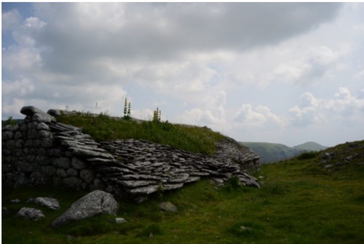
Buron situé au Col de la Chèvre (2013), Cantal (15).