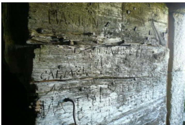
Porte de buron gravée des noms de différents buronniers.