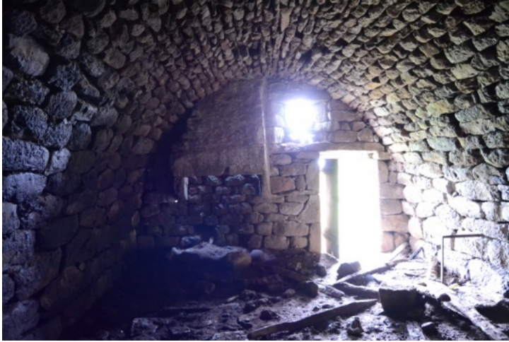
Intérieur du buron situé au Col de la Chèvre (2013), Cantal (15).