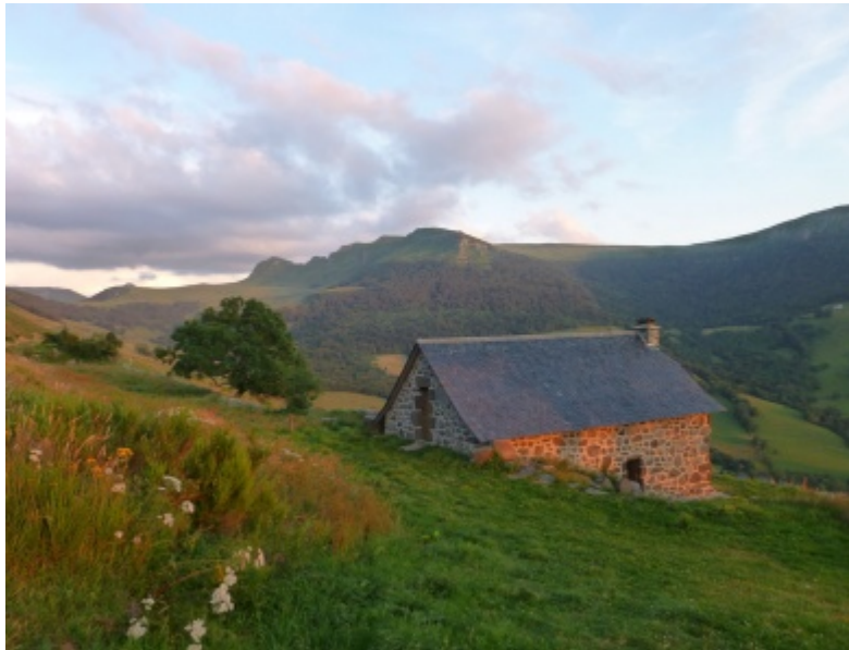
Buron du Roc de Labro, situé à Saint-Paul-de-Salers, Cantal (15).