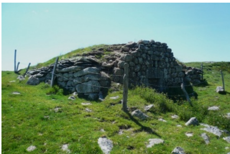
Buron dans l'Aubrac cantalien

Le mot « buron » n'est apparu qu'au début du XVII ème siècle. Auparavant le nom de « tras », « tras » ou « mazuc » pour les désigner étaient plus employés. Ils servaient plutôt à nommer une simple cavité allongée recouverte de branchages comme seule couverture. Leurs traces souvent groupées, contrairement aux burons plus récents, se voient encore parmi certaines estives.