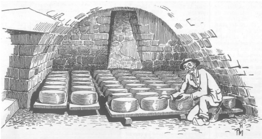
Cave à fromages d'un buron. Au fond, un sopirail permet l'aération de la cave. Dessin Pierre Moreau © 1977