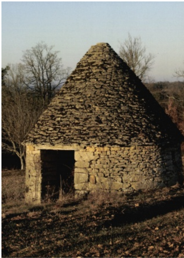
Borie entre Sarlat et Montignac en Dordogne