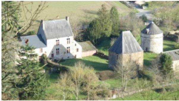
Manoir de Linthe à Saint-Léonard-des-Bois, avec sa fue à droite.