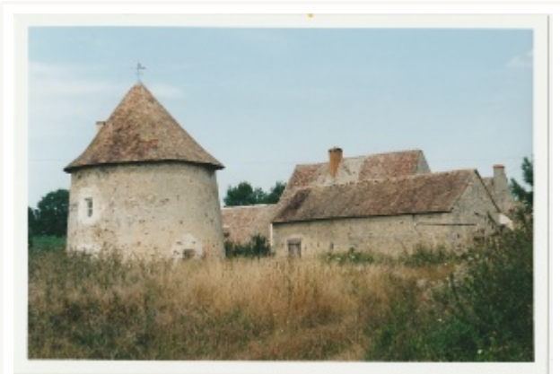
Fuie du manoir de Penloup à Saint-Georges-du-Rosay.