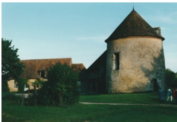
L'Etang Bécanne à Montmirail.

Saint-Aubin-de-Locquenay : fuie du château de Perrochel