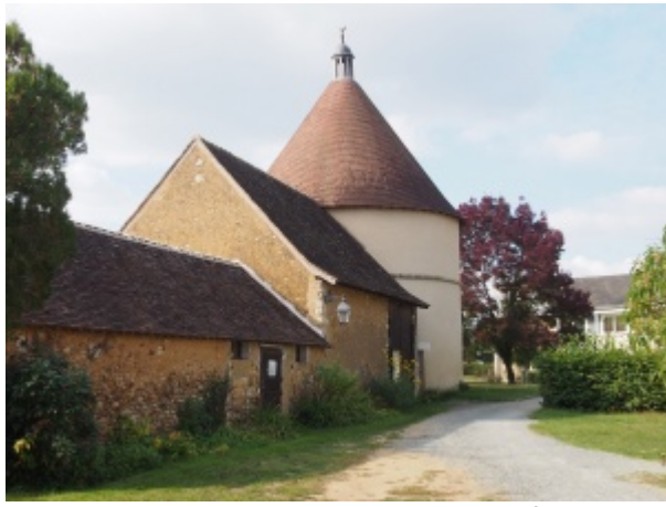
Colombier de l'abbaye de Tuffé.