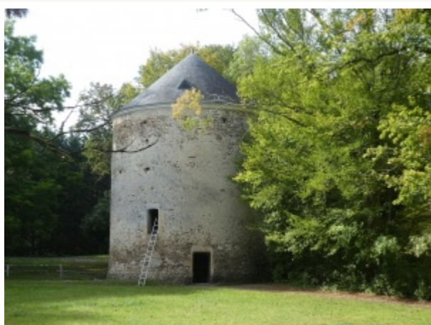
Colombier du château de Créans.