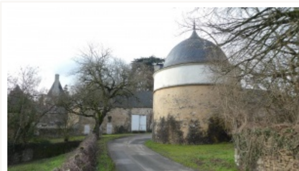
Colombier du château de Vassé, à Rouessé-Vassé

Verneuil-le-Chétif : bâtiment communal XVII s, 608 boulins, restauration en 2021