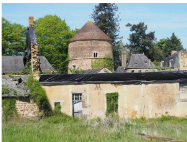
Colombier du château de Vernie