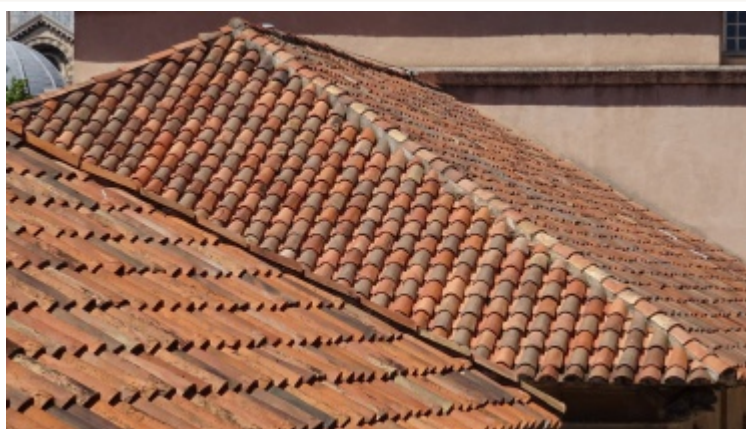
Toiture en tuiles canal avec vue sur arêtier, Centre de la Vieille Charité (Marseille)

Les tuiles recouvrantes vont dans le sens inverse des vents dominants et la tuile du faîtage arrivant sur le pignon devra être posée légèrement en débord.