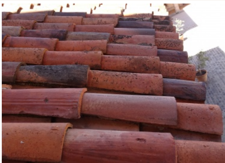
Pose de tuiles canal

Il est possible autrement de disposer des casseaux de tuiles aux extrémités de chaque rangée afin de caler la tuile canal dessus et continuer la pose qui sera ainsi bien maintenue. Aujourd'hui, ces cassots sont bien souvent remplacés par des liteaux. Les tuiles courantes sont alors posées entre liteaux mais ne sont pas en contact avec les voliges.