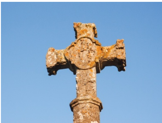
11-Douillet-le-Joly, croix cimetériale en calcaire.