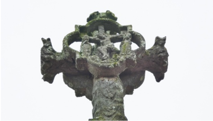
13-Croix centrale du cimetière de Pezé-le-Robert.