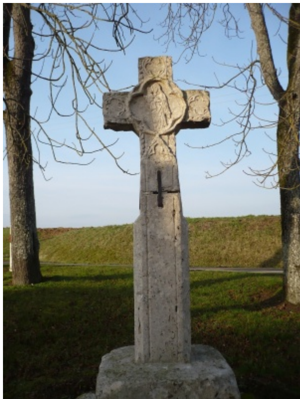
Granchamp, croix aux Dames. -2-