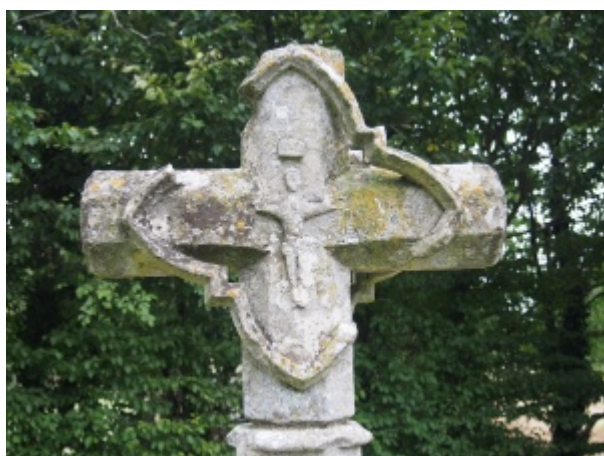
Croix de l'ancien cimetière d'Athenay (ancienne paroisse de la commune de Chemiré-le-Gaudin), -15-