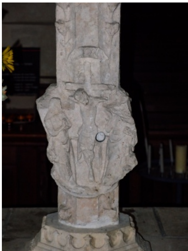
Reste d'une croix gothique provenant de Villaines-sous-Lucé, situé à Crissé,. -3 -