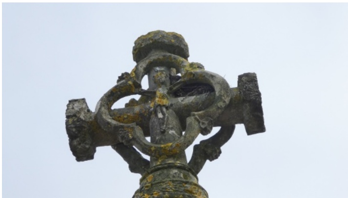
6-Teillé, croix cimetériale, côté Christ.