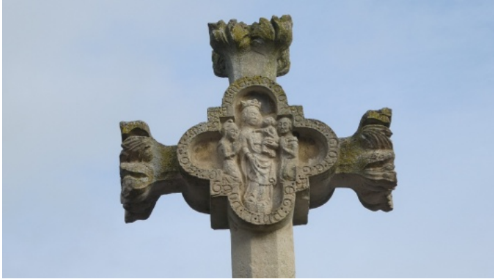
7-Congé-sur-Orne, Vierge et l'enfant Jésus accompagnés de personnages, probablement les donateurs.