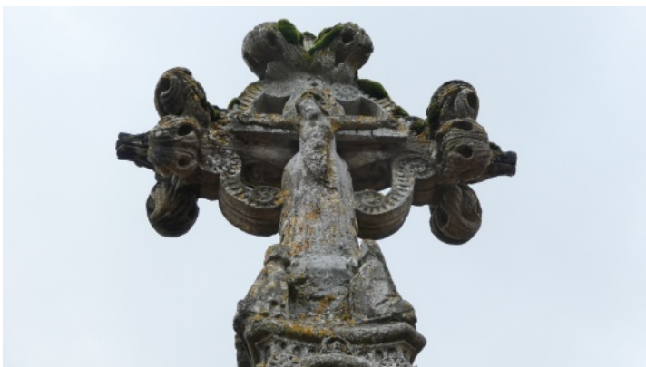
14-Croix centrale du cimetière d'Yvré-l'Evêque.