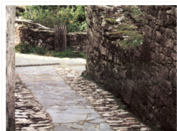
Dallage village cévenol

Le dallage est un revêtement de sol que l'on fait avec des pierres relativement peu épaisses et plates, posées à l'horizontale sur un « lit de carrière » (pour les schistes).