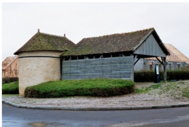
Four à chanvre double accompagné de sa loge, situé à Lucé-sous-Ballon.