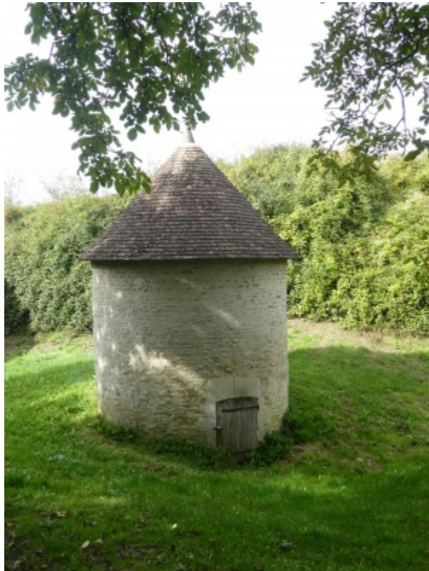
Four à chanvre situé à St Rémy du Val