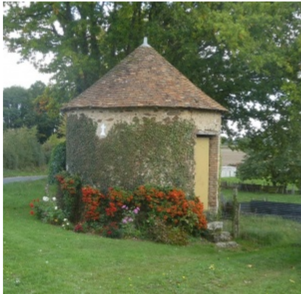
Four à chanvre situé à Les Bondés, Assé-le-Riboul.