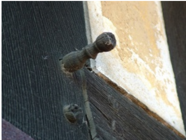
Cheville "tournée" - Le Petit Boisney 27800 Boisney Charreterie XVIIIème