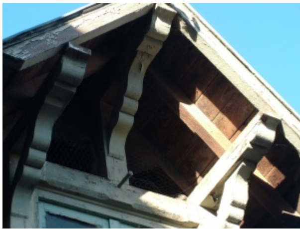
Cheville sur lucarne à chevalet - bâtiment usine d'emballage de fromage - 14140 LIVAROT