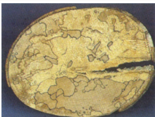
Échauffure sur du hêtre