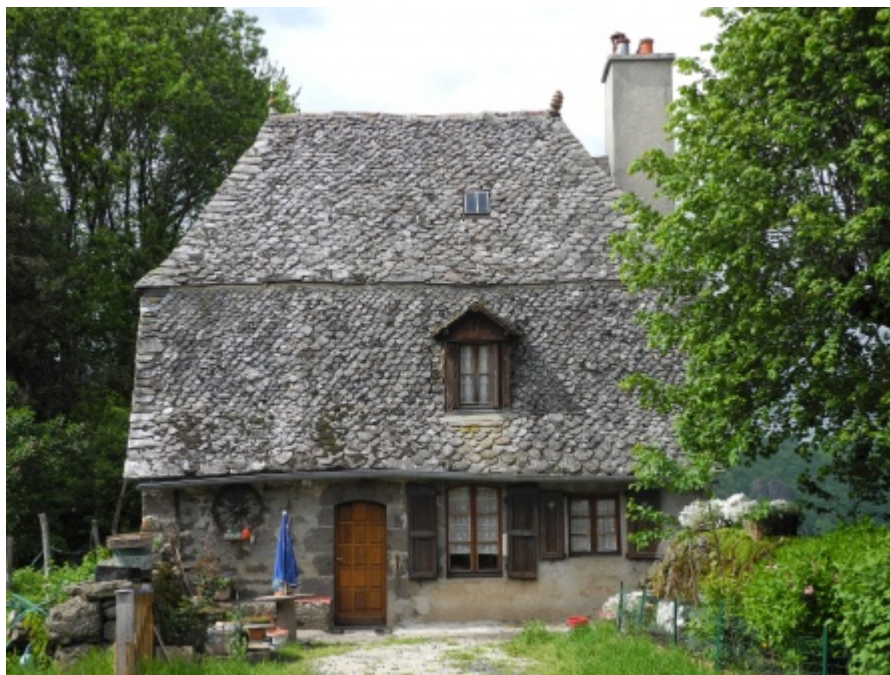
Maison paysanne dans le Cantal