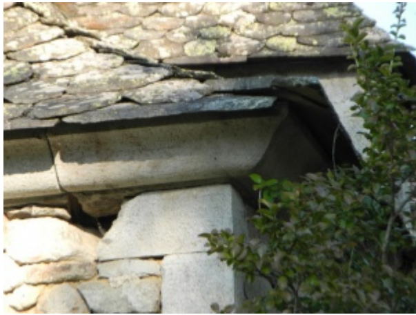
Doucine sous une toiture dans le Nord Cantal