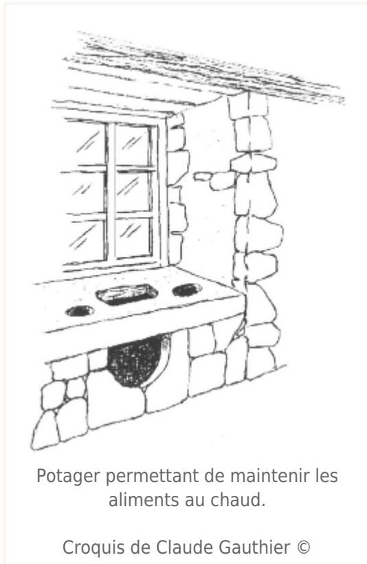
Potager permettant de maintenir les aliments au chaud.