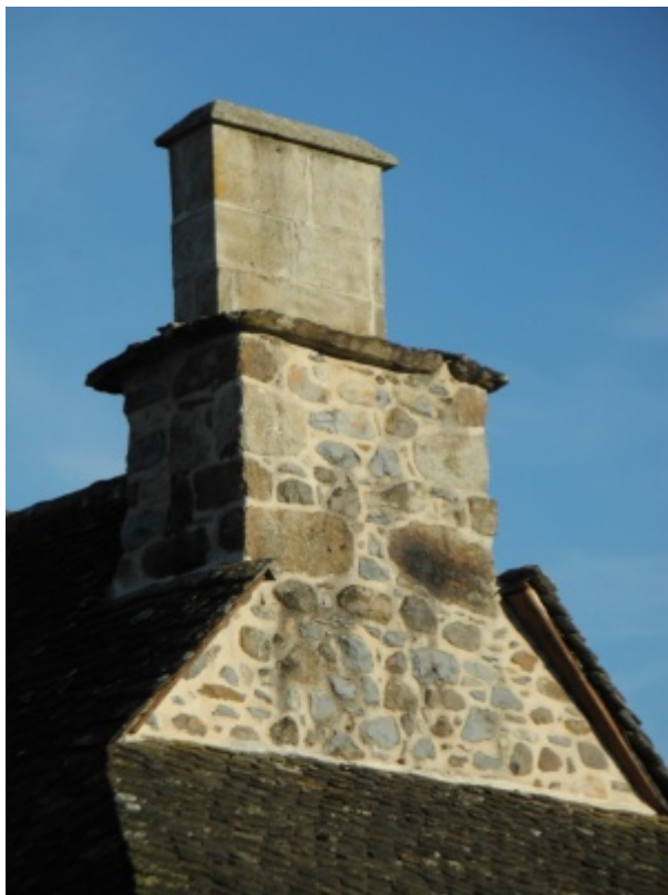
Souche de cheminée dans le Nord Cantal