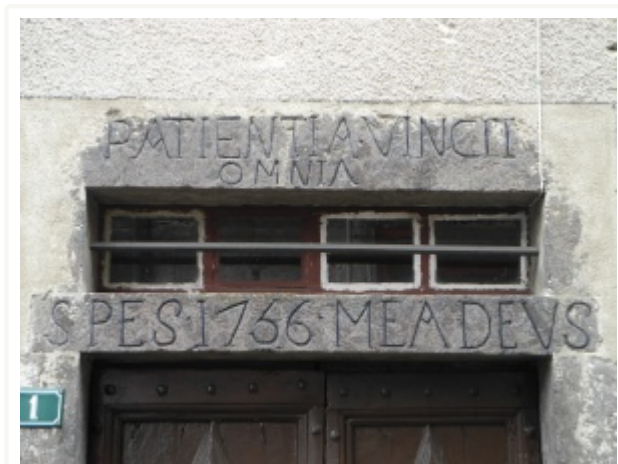
Linteau gravé à Saint-Martin-Valmeroux

L'évolution architecturale de cette maison se manifeste par la transformation du plan et l'apparition de pièces supplémentaires. On constate ainsi l'apparition de la «chambre » à côté de la salle commune et la possibilité d'un doublement de la maison en profondeur par l'ajout d'appentis (petit bâti avec toit à une seule pente) à l'arrière. La maison peut également posséder un étage voué à l'habitation, alors desservi par un escalier intérieur perpendiculaire au mur gouttereau.