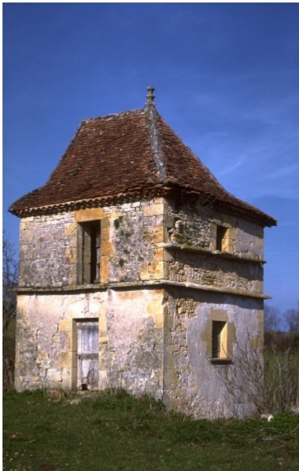
Pigeonnier garde-pile dans le Lot.

Marqueur social, ils illustrent la modestie ou l'aisance du propriétaire, allant de simples trous dans le mur du grenier à des tours majestueuses rondes, carrées ou aux formes et matériaux caractéristiques de la région.