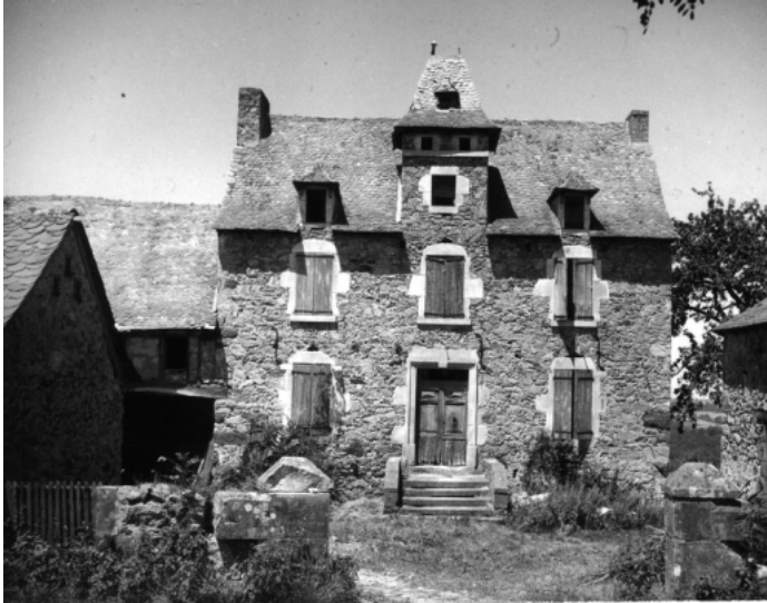
Pigeonnier-tourelle central avec toit d'ardoises situé Maleville (Communauté de communes du Grand Villefranchois), Aveyron (12).