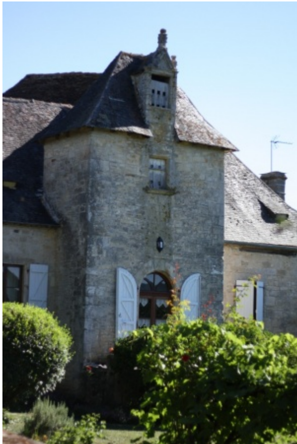
Pigeonnier-tourelle situé à Sarrazac, Lot.

Ce pigeonnier est situé au centre d'une façade symétrique. Construit en pierre, il est couvert d'un toit d'ardoise avec léger coyautage. Une lucarne en pierre est décorée de pinacles. Les pigeons accèdent au pigeonnier par des grilles d'envol en bois.