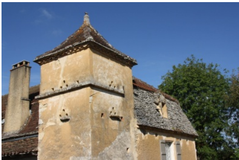
Pigeonnier tourelle situé dans le Hameau Les Cazettes (près de Marminiac), Lot (46).

Ce pigeonnier en pierre calcaire est couvert d'un enduit à la chaux ocre. Les différents trous d'envol sont disposés de manière triangulaire devant lesquels dépassent des bandeaux de pierres ou pierres d'envol. Le toit à quatre pans à léger brisis est couvert en partie basse de laves calcaires puis de tuiles plates. Dessous, la génoise est en briques plates et tuiles canal. Il dispose d'un épi de faitage en forme de pigeon.