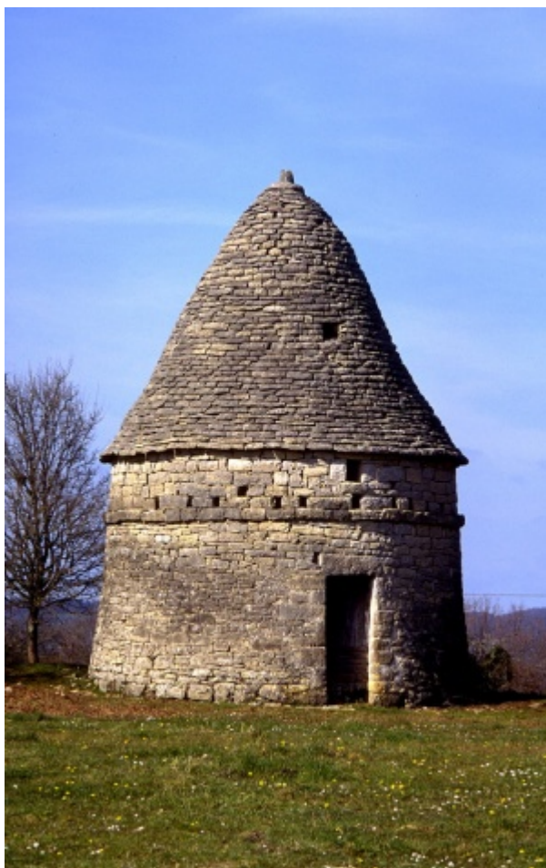
Pigeonnier cabane à les Escarits (Haut-Quercy), Aveyron.

Les arêtes de ce toit en « escalier » peuvent être couvertes d'un morceau de toiture peu large couvertes de tuiles canal ou bien d'une rangée de tuiles canal scellées à la chaux. Celles-ci sont parfois couronnées d'épis de faîtage (ou pinacles).