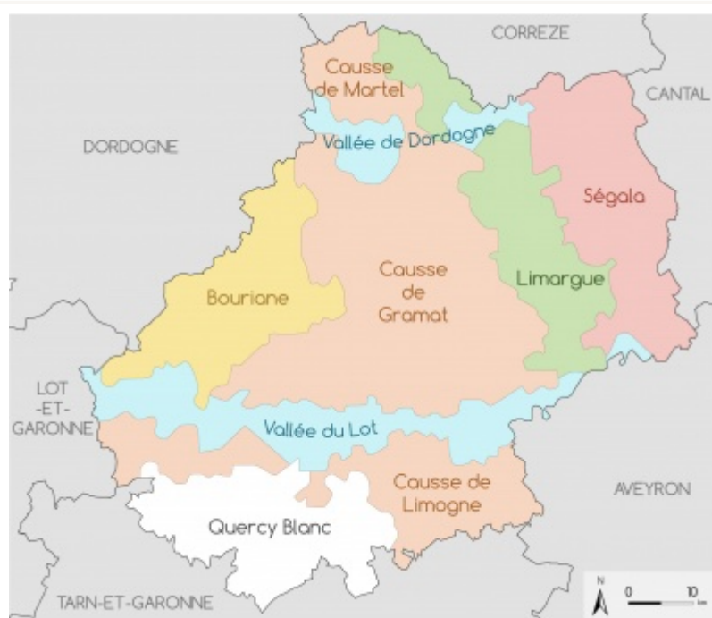
Régions naturelles du Quercy.