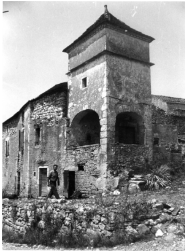
Pigeonnier-tourelle au-dessus du bolet, situé à Espère, Lot.

1962