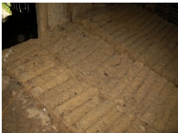
Pose de quenouille de torchis.