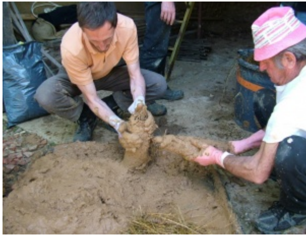
Réalisation de quenouilles de torchis à la main

3) La terre d'argile extraite, elle est tamisée puis délayée dans de l'eau afin d'en faire une barbotine. Une partie de cette pâte d'argile est mise de côté pour en faire un enduit de lissage en fin de pose des quenouilles.