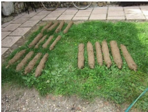
Quenouilles de torchis

Le mélange peut aussi être fait au malaxeur afin de rendre sa réalisation plus facile encore et être rentable en terme de temps et de main d'œuvre. Le torchis obtenu doit être une terre argileuse renforcée par la paille qu'elle contient plutôt que du foin collé par peu d'argile.