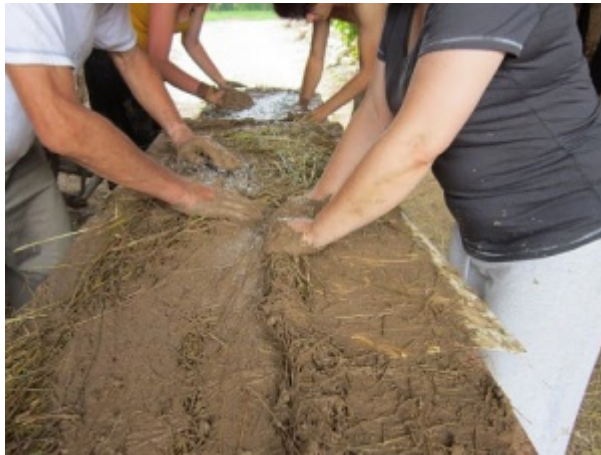
Mélange barbotine et foin

La fabrication des quenouilles se fait avec un mélange de terre argileuse, d'eau, de foin s'enroulant autour d'un bâton de châtaigner, de chêne ou hêtre préalablement fendu et dont l'écorce et l'aubier auront été enlevés. [1]