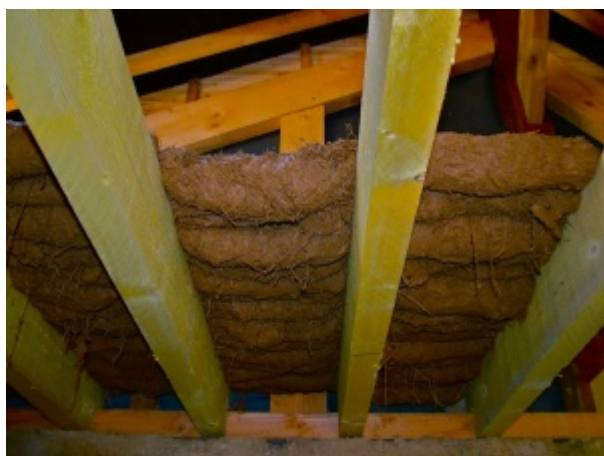
Pose des quenouilles entre les solives, vue de dessous.