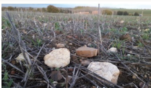
Gisement dans un champs - Photo Denis-Marie Lahellec - Maisons Paysannes de la Sarthe.

Traditionnellement, les matériaux constitutifs du bâti sont puisés dans l'environnement le plus proche; c'est aussi vrai des matériaux utilisés pour les sols, qu'ils soient ordinaires, comme les graviers, sables, ou faluns des cours et allées, ou plus élaborés comme les pavages, dallages ou calades des terrasses, escaliers ou perrons par exemple.