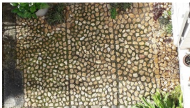
Vue d'ensemble de la terrasse - Photo Denis-Marie Lahellec - Maisons Paysannes de la Sarthe.

de rognons de quartz, de couleur blanc, jaune ou bruns.